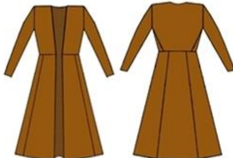
სურ. 5. თუში ქალის ჩოხა