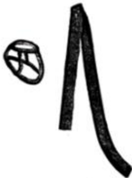
სურ. 8. თუში ქალის თავსაბურავი