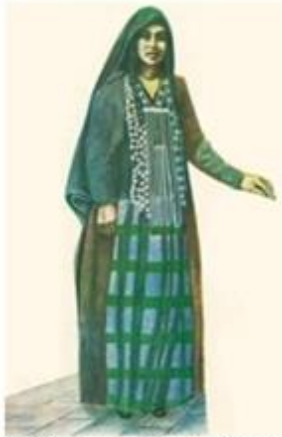
სურ. 1. თუში ქალი ეროვნულ სამოსში