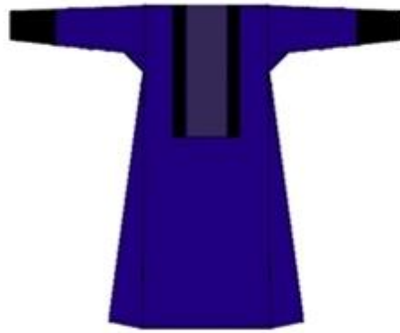
სურ. 2. თუში ქალის ჯუბა