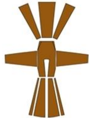
სურ. 6. ჩოხის კონსტრუქცია