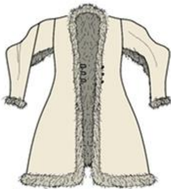
სურ. 7. თუშური კოკა