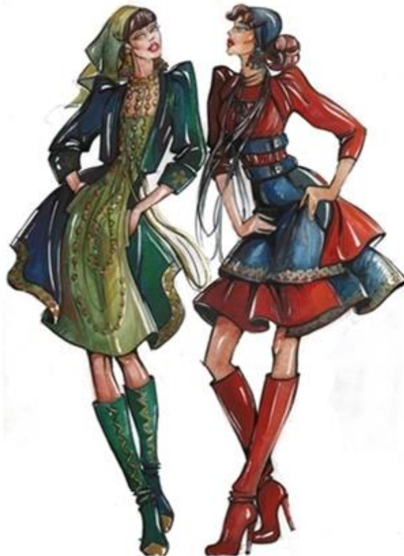
სურ. 9. თუშური ეთნოკოსტიუმის ელემენტები თანამედროვე ტანსაცმელში