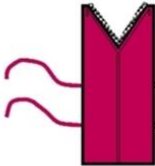
სურ. 4. ფარგული