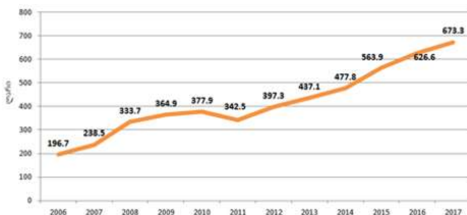
დიაგრამა №2. განთავსების საშუალებებით უზრუნველყოფის და საკვების მიწოდების საქმიანობით დაკავებულ საწარმოებში დასაქმებულთა საშუალოთვიური შრომის ანაზღაურება (ლარი)