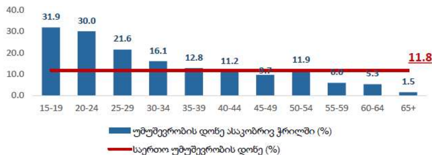
დიაგრამა №1. უმუშევრობის დონე ასაკობრივ ჯგუფში (%)